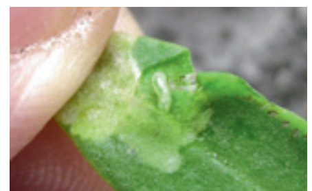
Foto 3. Schade aan de kiembladeren door de larve van de bietenvlieg.