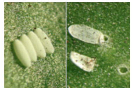
Foto 2. Als de eieren van de bietenvlieg bol zijn, dan zit hierin nog een levende larve (links). Bij platte eieren, is de larve er al uit (rechts). Of ze bol zijn is te zien met een loep.