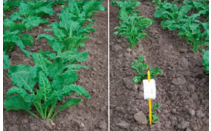
Foto 1. Het effect van standaard (rechts) en speciaal (links) pillenzaad op de zwarte bonenluis.

Bij de rassenkeuze dient u aan te geven of u standaard of speciaal pillenzaad wilt bestellen. Standaard pillenzaad heeft geen insecticiden. Speciaal pillenzaad bevat een insecticide (Poncho Beta of Cruiser). Welke dat is, is afhankelijk van het ras dat u bestelt. In proeven hebben wij geen verschillen aangetoond tussen deze twee middelen. Dit artikel geeft een overzicht tegen welke insecten speciaal pillenzaad effectief is en aan de hand van voorbeelden kunt u lezen hoe het werkt.